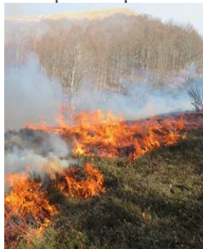
FUOCO PRESCRITTO, LOCALITA' CUTIGLIANO (PT)