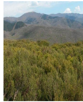
AREA DI INTERVENTO, PROGETTO LIFE GRANATHA