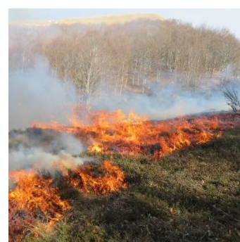
Intervenciones del proyecto "Life Granatha"