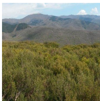
Quemas prescritas en la localidad Cutigliano (PT)